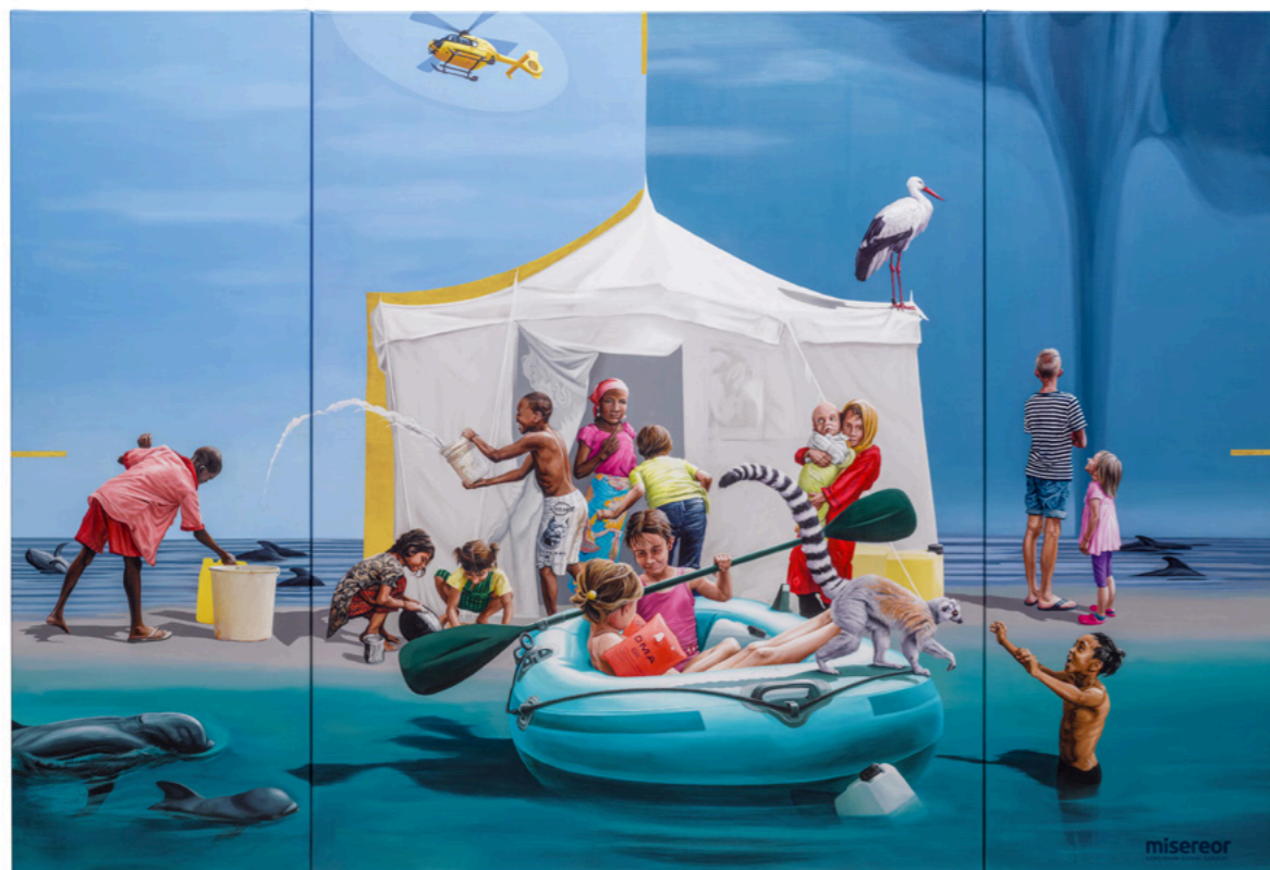
Misereor-Hungertuch „Gemeinsam träumen – Liebe sei Tat“ von Konstanze Trommer © Misereor