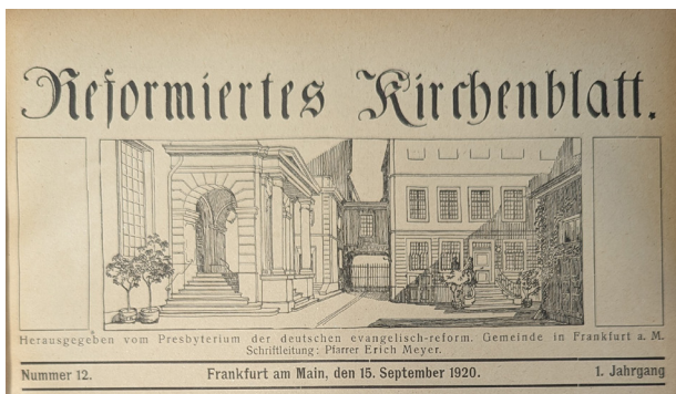
Bis 1941 erschien das Kirchenblatt mit diesem Layout. Zu sehen sind die Kirche am Kornmarkt (links) und das baulich angeschlossene Gemeindehaus (rechts)