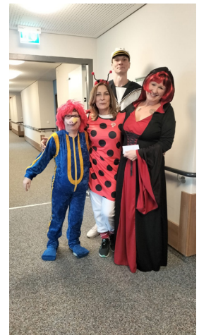
Text und Bilder von Christina Fischer