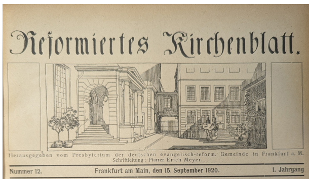
Bis 1941 erschien das Kirchenblatt mit diesem Layout. Zu sehen sind die Kirche am Kornmarkt (links) und das baulich angeschlossene Gemeindehaus (rechts)