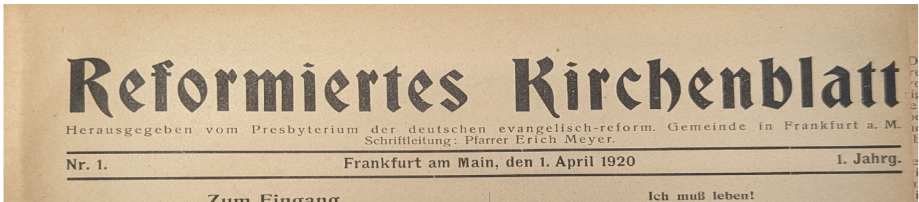
Die erste Ausgabe des Reformierten Kirchenblattes